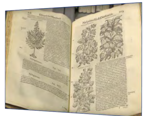
Fondo storico - Biblioteca di Lettere e Filosofia