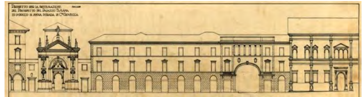
Progetto di trasformazione esterna del palazzo di Sant'Anna (1931 ott.) Biblioteca di Architettura